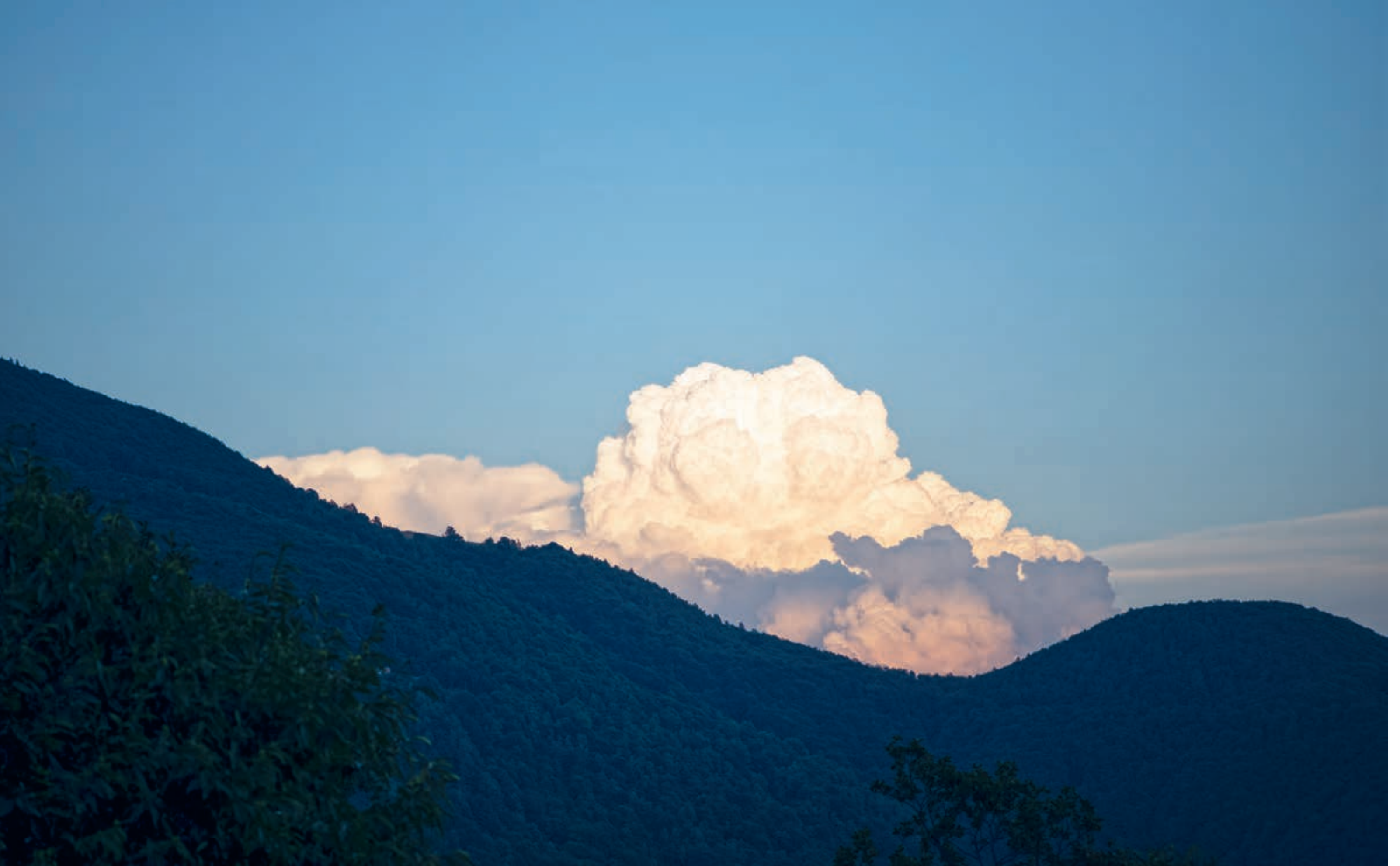
Auf dem Weg in die Monti Cortoi lässt man den Blick auf die Magadino-Ebene im Verzascatal hinter sich. Über den Wolken bleibt es still.